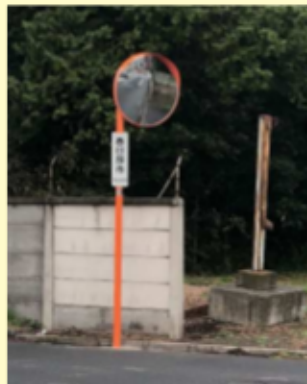
大森 378 カーブミラー設置