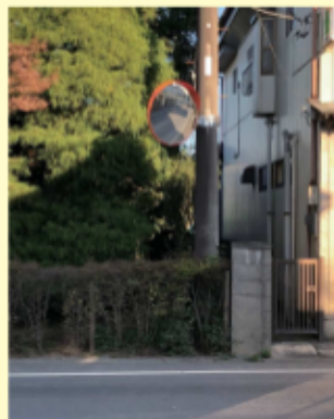
西宝珠花 697 カーブミラー設置