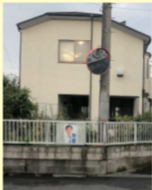
新宿新田 カーブミラー設置