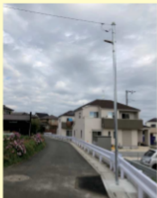
東中野 1485 新規街灯設置