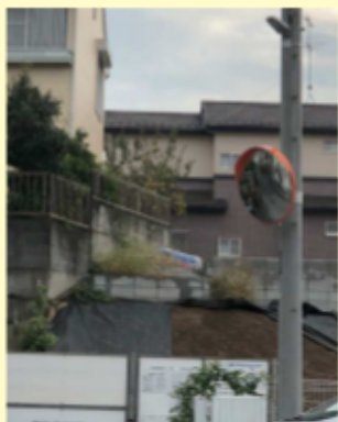
大森 253 カーブミラー設置