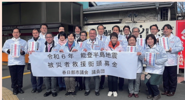
2024年1月13日 春日部市議会議員有志で能登半島地震被災者救援募金を春日部駅西口・東口で行いました。