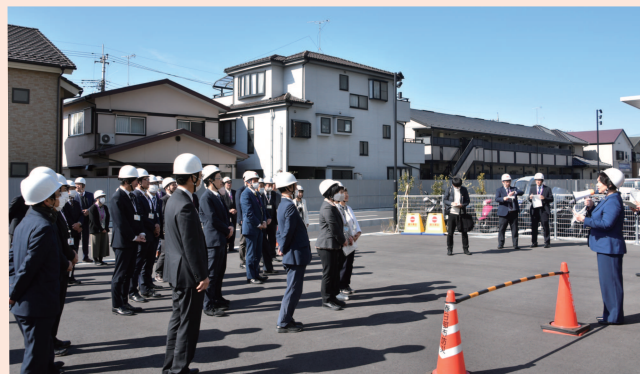
2024年3月11日 議場からの避難訓練を議員と執行部で行いました。