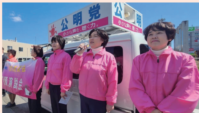
2024年3月13日 公明党女性委員会は、国際女性デーと女性の健康週間を記念して街頭演説会を行いました。